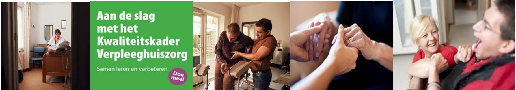
Kwaliteitskoepel langdurige zorg